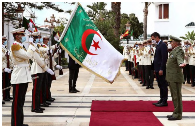
Viaje del presidente del gobierno Pedro Sánchez a Argelia.(Octubre 2020)